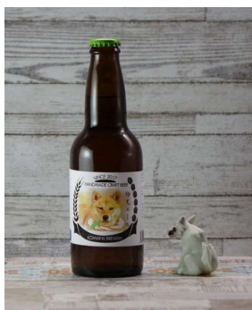
千葉県柏市の地ビール (こまいぬブルワリー 柏麦酒) 太陽のエール 330 ml