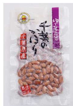
千葉県産ゆで落花生 (酒井のピーナツ) 千葉のかほり 100 g