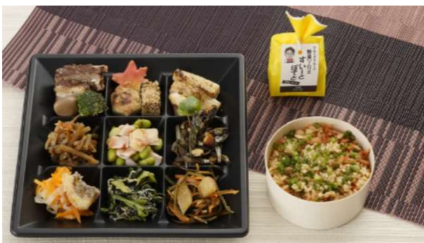
和食コース(ライト)スイートポテト付き (銀座クルーズ)

さらに有料のオプションとして 、ご希望の方には、ケータリングで食事と千葉県産ビール、ゆで落花生のセットをお手元にお届けします。直接に会うことが難しい中、短い時間ではありますが、同じ料理を食べながら会話を楽しんでみませんか？懇親会参加の際は、ぜひご利用をご検討ください。懇親会用のケータリングと一緒に乾杯しましょう！